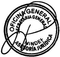
PEDRO ALVARO CATERIANO BELLIDO Ministro de Defensa